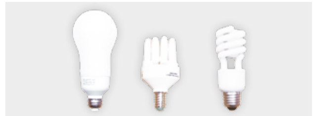
Les LFC sont disponibles partout et une gamme étendue existe.

Pour ceux équipés d'un variateur, la compatibilité de la lampe est indiquée sur son emballage ; • leur prix a beaucoup diminué ; • certaines LFC sont équipées de systèmes à baïonnette : il n'est pas nécessaire de remplacer toutes les douilles de ce type.